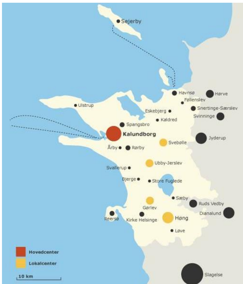
Figur 4 Bymønstret i Kalundborg Kommune jf. Kommuneplan 2017-2028.

Derudover er der defineret en række landsbyer, se Figur 4.