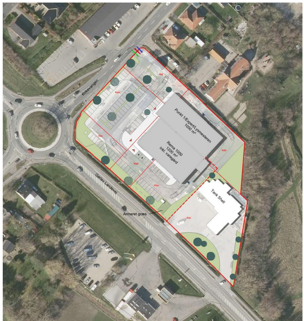
Figur 1 Afgrænsningen og disponering af projektområdet på det østlige hjørne af rundkørslen Gørlev Landevej-Kirkevangen-Helsingevej.

Det nugældende plangrundlag, der omfatter projektområdet, muliggør ikke etablering af den nye dagligvarebutik og genetablering af udvalgsvarebutikkerne. Etablering af den nye dagligvarebutik forudsætter bl.a. vedtagelsen af et kommuneplantillæg, der muliggør projektet. Rema Ejendomsudvikling A/S har derfor bedt COWI om at redegøre for planlægningen for en ændret afgrænsning af bymidten.