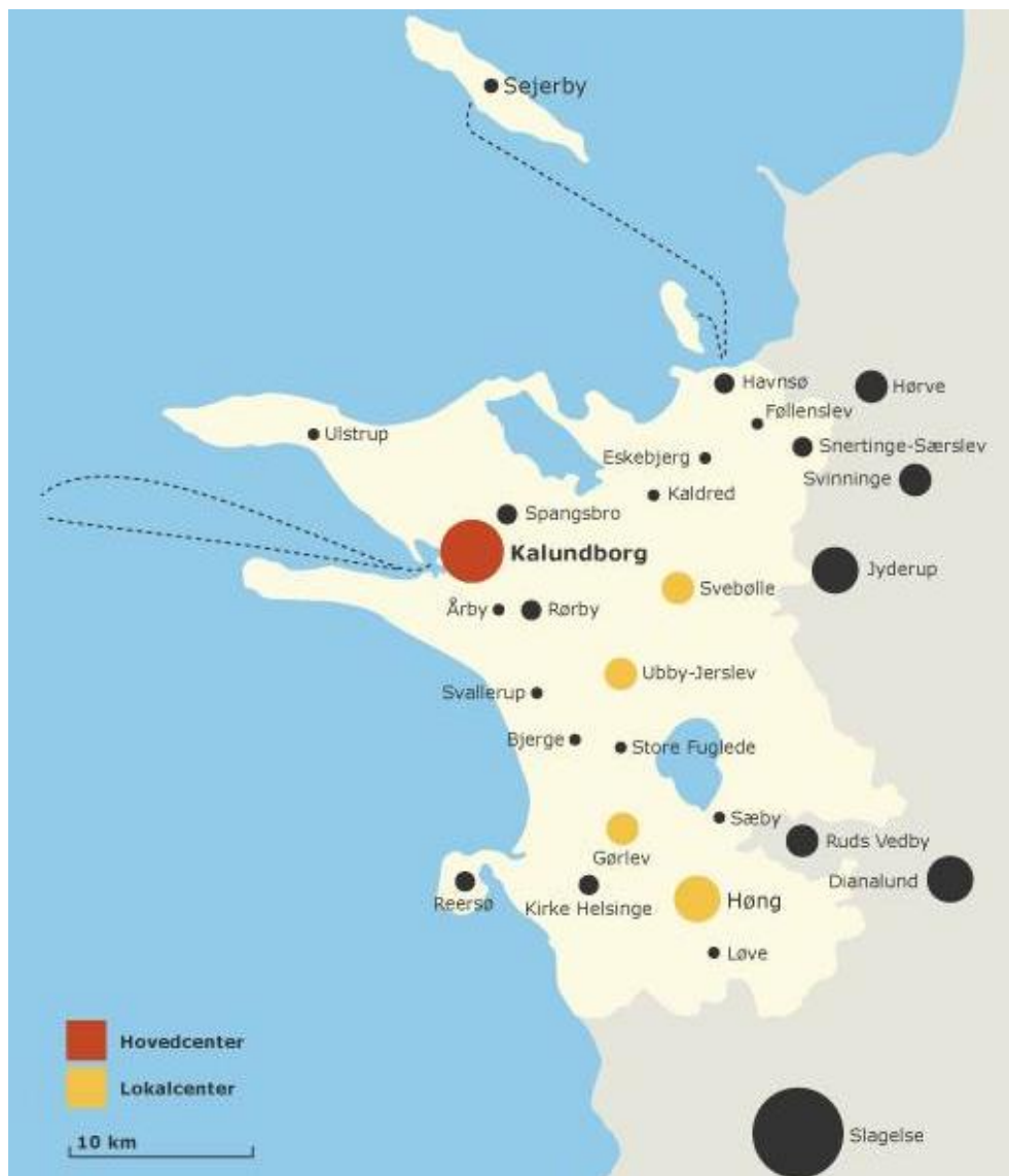
Figur 4 Bymønstret i Kalundborg Kommune jf. Kommuneplan 2017-2028.

Derudover er der defineret en række landsbyer, se Figur 4.