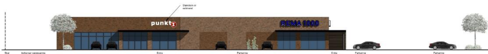
Figur 3 Facade mod Kirkevungen.