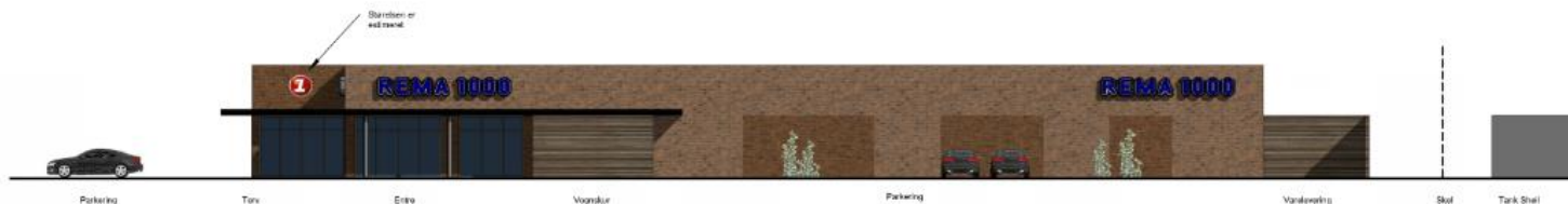
Figur 2 Facade mod Gørlev Landevej.

Nedenfor ses et eksempel på udformning af facader og materialevalg til det nye butiksbyggeri i projektområdet.